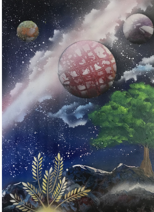
Ferhat DÜNDAR “İsimsiz” Forex Üzeri Sprey Boya, 50 x 70 cm, 2018