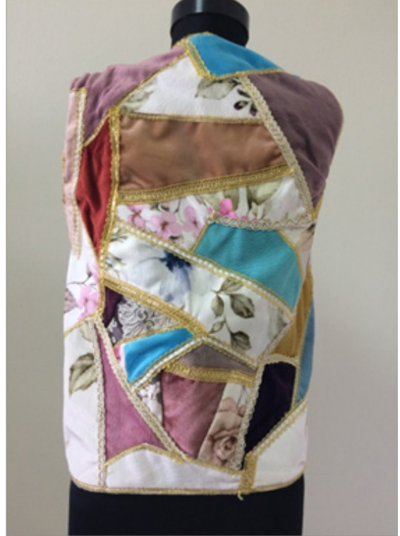
Selma ÖNBAŞ “Pare Pare” Kirkyama, 45 x 60 cm, 2018