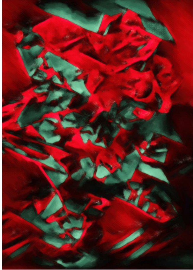
Müge ERTEMLİ “İsimsiz” Dijital Baskı, 50 x 70 cm, 2018