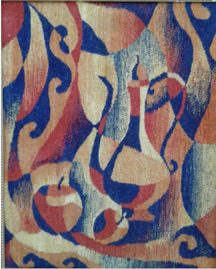
Serikbaeva Perizat ŞOTOBAİKIZI “Doğu Natürmort” Goblen (İplik), 60 x 50 cm, 2015