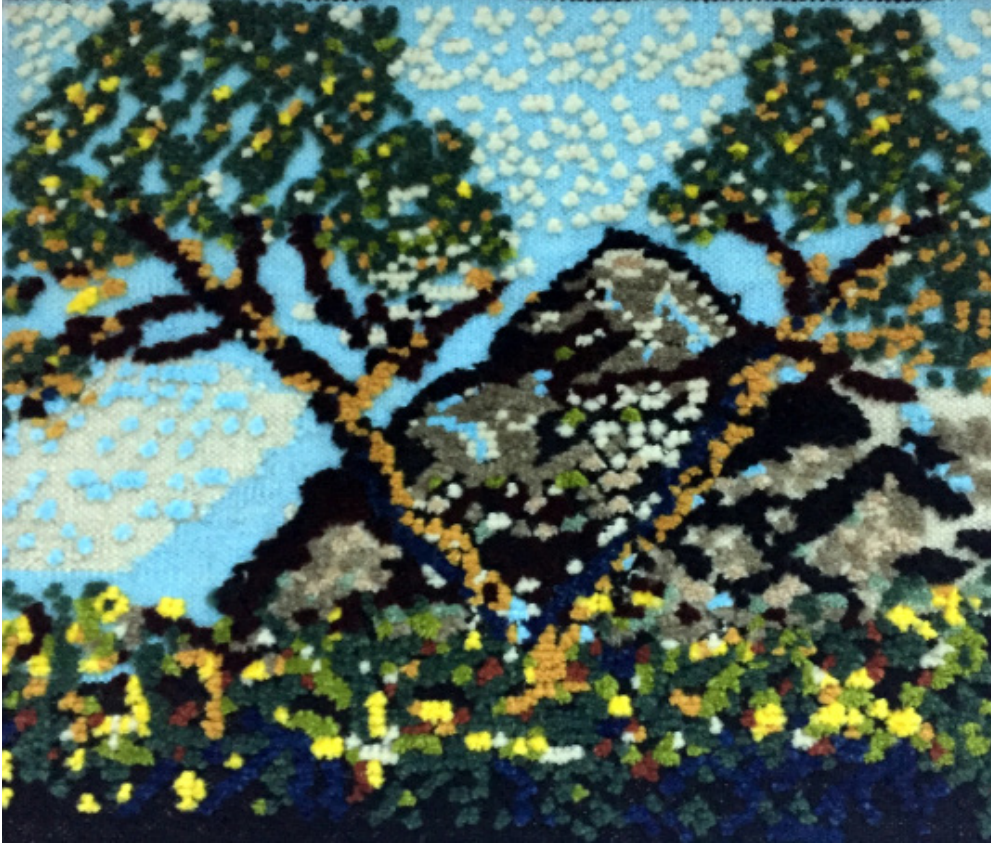
Ömer ZAIMOĞLU “Antalya” Goblen Dokuma, 55 x 55 cm, 2018