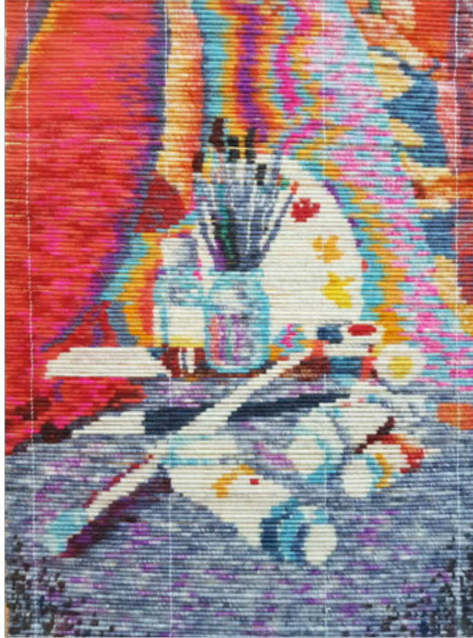
Bisenbaeva Alina TALGATKIZI “Sanatçı natürmort” Hasır (Şi,Yün), 60 x 40 cm, 2018