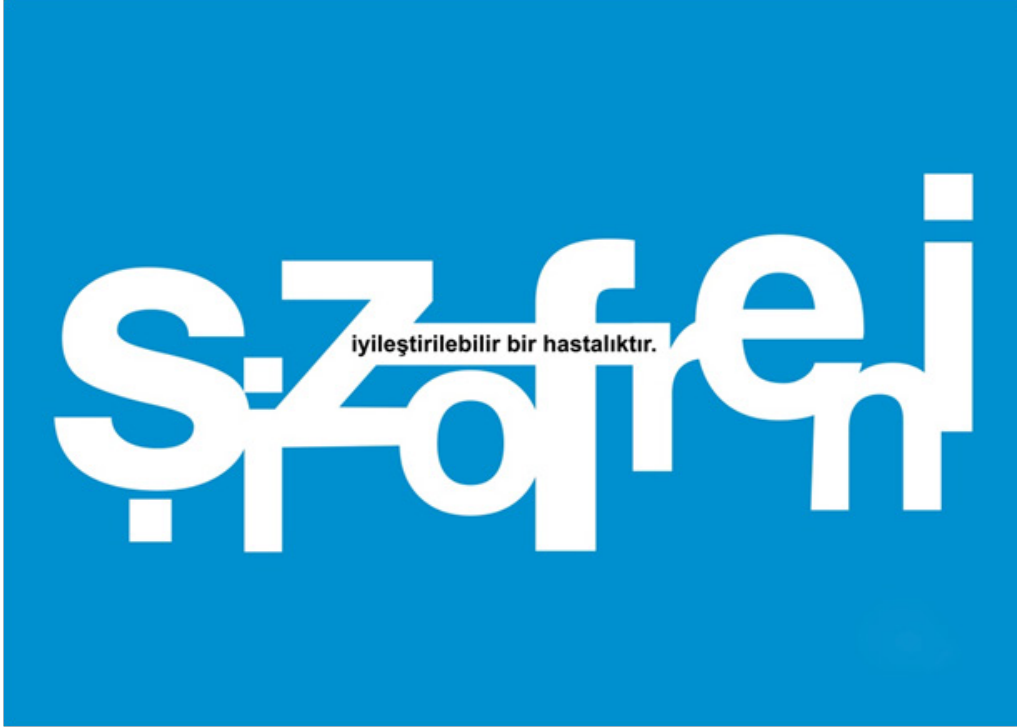
Çağrı GÜMÜŞ “Şizofreni” Dijital, 50 x 70 cm, 2018