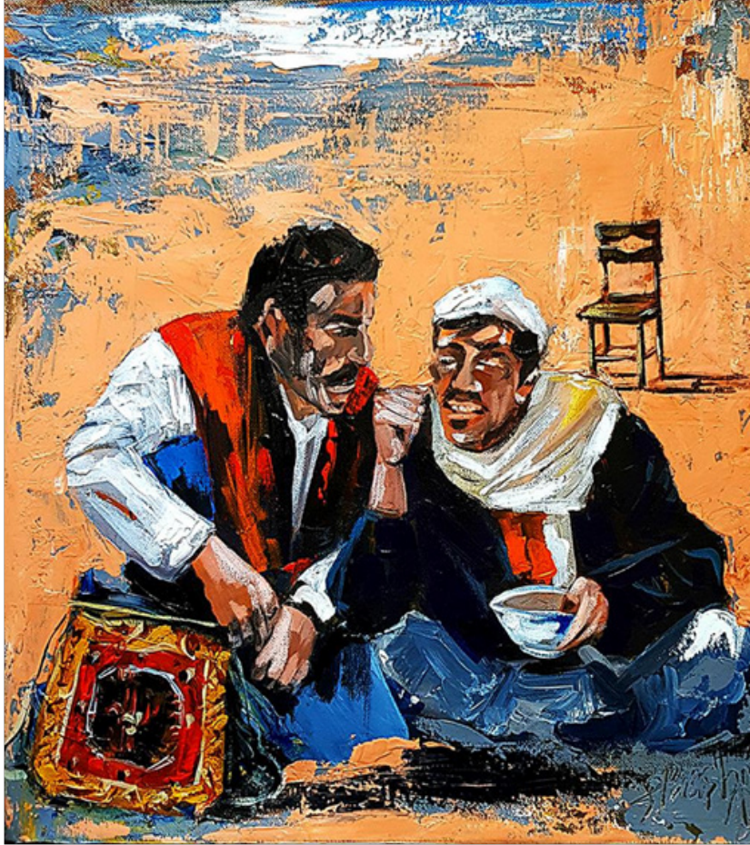
Fatih BAŞBUĞ “Dedikodu” TÜAB, 50 x 60 cm, 2018