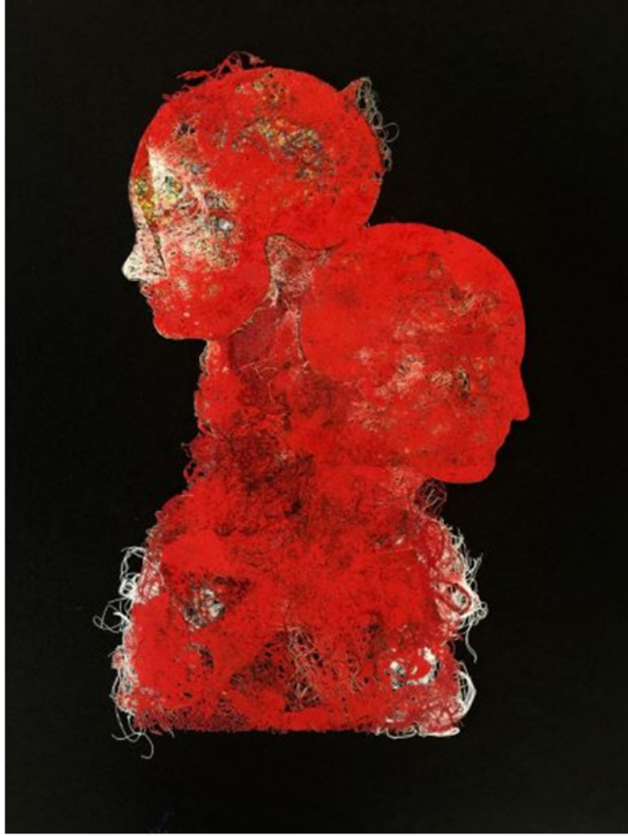
Özcan UZKUR “Fiberman” Karışık Teknik, 60 x 80 cm, 2018