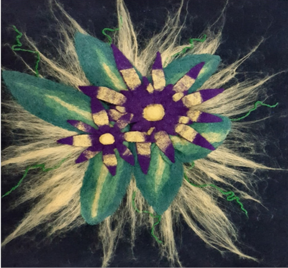
Zeynep Çiğdem ÇENGEL “İki Yıldız” İğneli Keçe, 50 x 50 cm, 2017