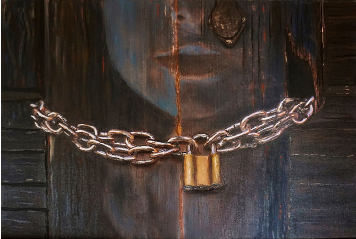
Ferrah Nur DÜNDAR “Kadın 68” TÜAB, 50 x 70 cm, 2018