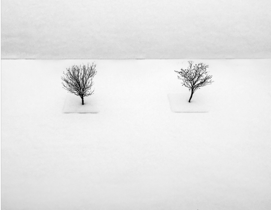
Eren GÖRGÜLÜ “Ayrı” Fotoğraf, 10 x 10 cm, 2017