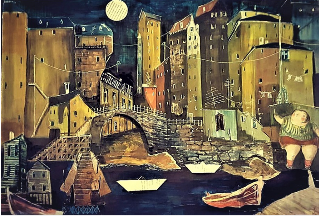
Bilge YARAEI “Rıhtım ve Kadın” Karışık Teknik-Kolaj, 50 x 70 cm, 2018