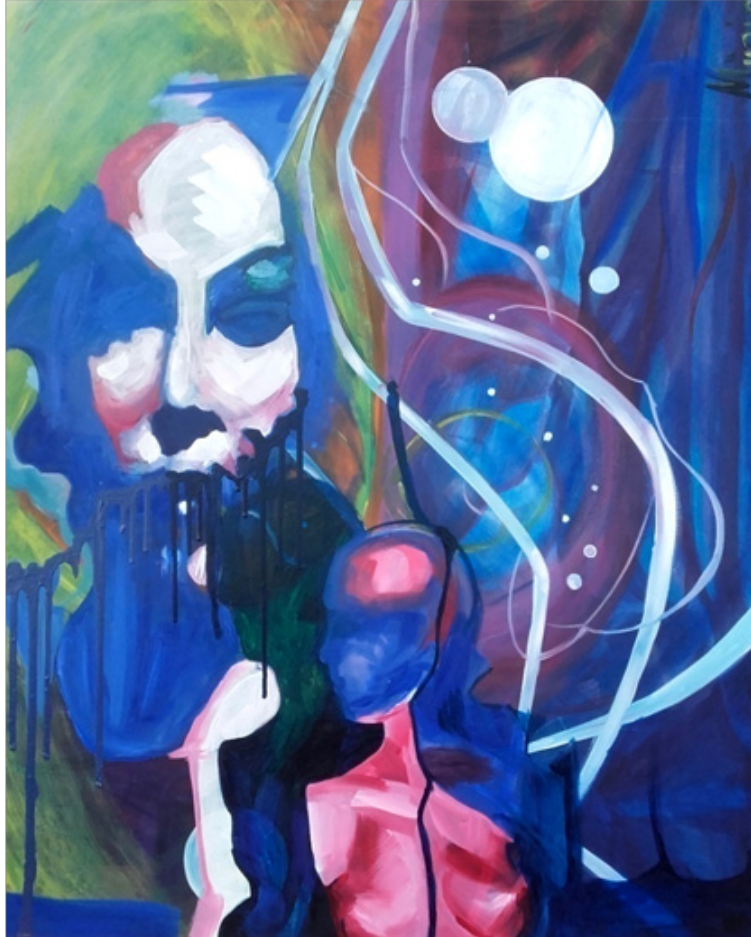
Münire ŞAHİN “Gölgeler ve Düşler” Tüyb, 80 x 100 cm, 2018