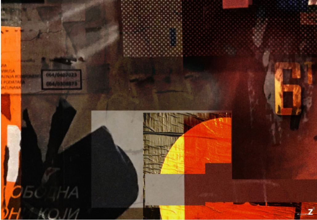
Aydın ZOR “İsimsiz” Dijital Baskı, 57 x 82 cm, 2018