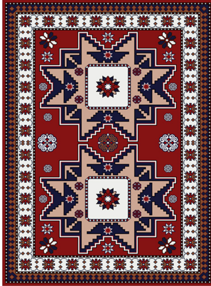
Esra ATİK “Bilgisayar Destekli Kars Yöresi Röprodüksiyon Çalışması” Dijital, 50 x 70 cm, 2018