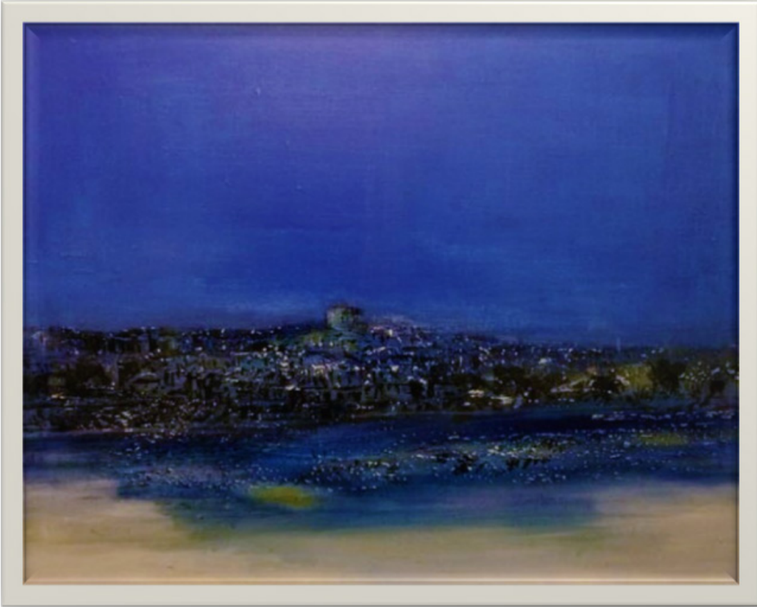
Metin UÇAR “Antalya” TÜAB, 60 x 70 cm, 2018