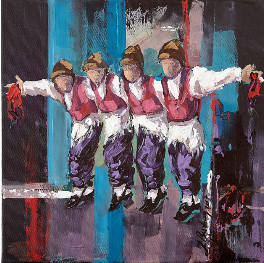
Zuhar BAŞBUĞ “Halay” TÜAB, 25 x 25 cm, 2017