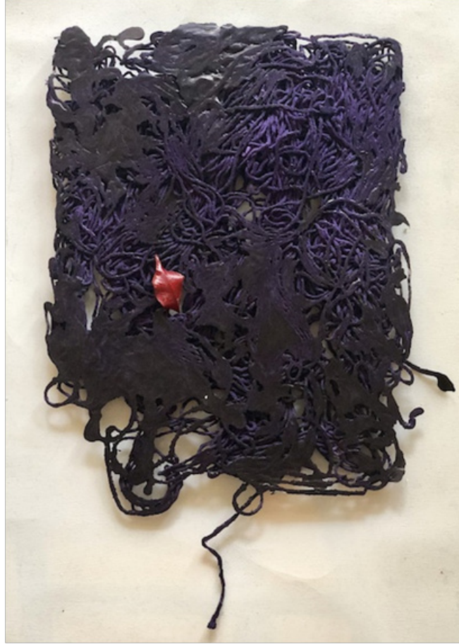
Berna KARAÇALI “Kördüğüm Tablet” Karışık Teknik, 30 x 37 cm, 2018