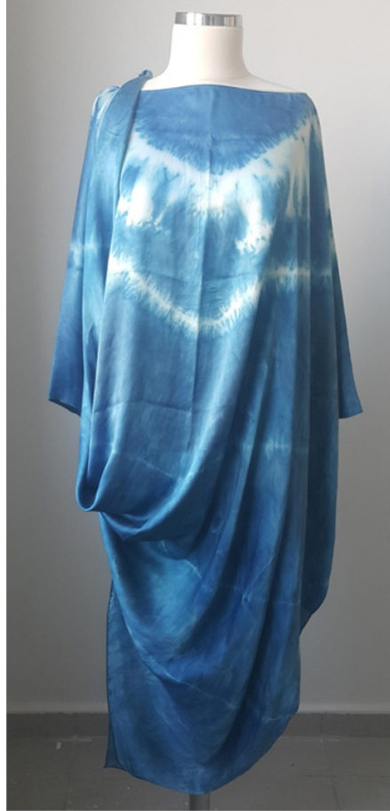
Menekşe Suzan TEKER “İsimsiz” Bağlama Boyama Tekniği ile Desenlendirilmiş ve Doğal Boya (indigoferatinctoria) ile Boyanmıştır, 100 x 150 cm, 2016