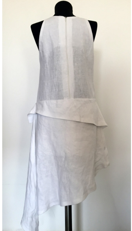
Mine YILDIRAN “3Dreams” 3D Printer ile Üretilmiş Yüze ve Keten Kumaş Kombine Edilerek Üretilen Tasarım, 45 x 125 cm, 2018