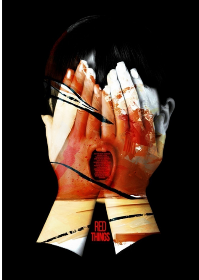
Ayşe Derya KAHRAMAN “Kırmızı Şeyler” Dijital, 50 x 70 cm, 2018