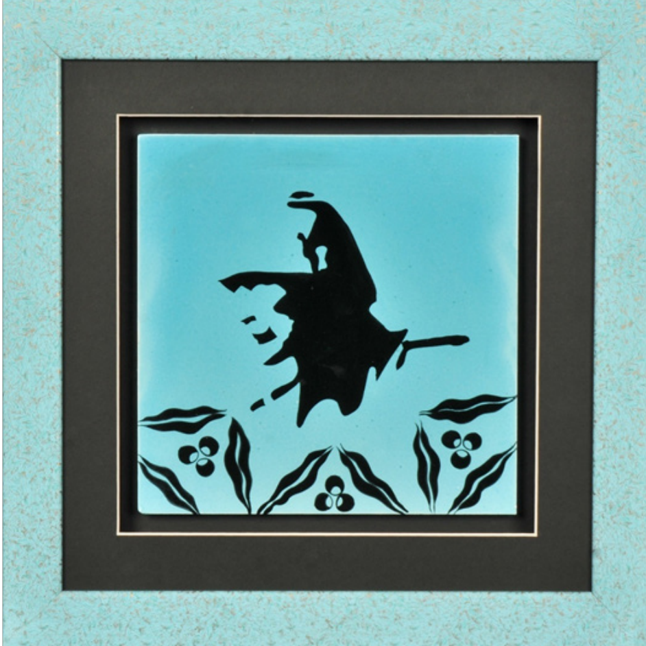
Serap Yıldırım GEREN “Atatürk” Sıraltı/Çini, 20 x 20 cm, 2017